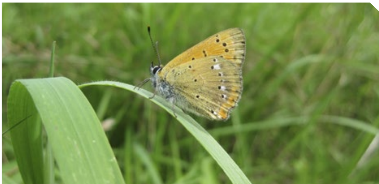
Dukatsommerfugl er en af de smukke dagsommerfugle, der trives på Flyvestation Karup.