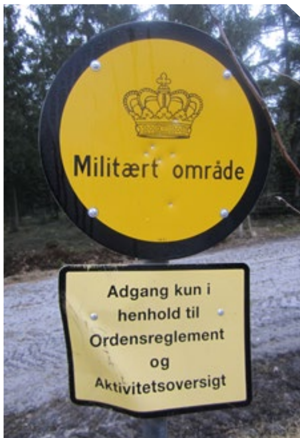
Adgangsplysninger ved indfaldsvej til Gedhus Plantage.

Notatets struktur består af et resume, der kort op-ridser evalueringens hovedkonklusioner. Resumeeet vil efterfølgende indgå i den nye drifts- og plejeplan som bindeleddet mellem de to planudgaver. Efter resumeeet fremgår en mere grundig aktivitetsgennemgang, der opdeler aktiviteterne på: Militæranvendelse, naturbeskyttelse og publikumshensyn. Inden for hvert emne gøres status over de udførte aktiviteter sammenlignet med det planlagte niveau. Aktivitetsgennemgangen efterfølges af en oversigt over de overtagne aktiviteter, der af forskellige årsager ikke er udført indenfor planperioden, men i stedet overføres som input til den nye drifts- og plejeplan, hvor de udsættes for nærmere analyse.