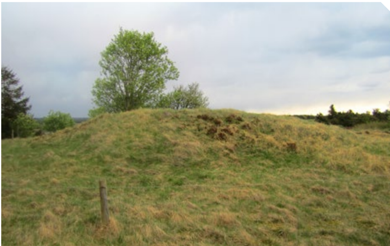
Fortidsminde med beskyttende afspærring.