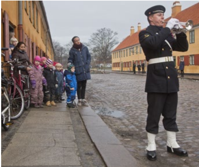
På de to øverste billeder, ses interiør fra de første boliger i etape 2, der blev indflytningsklare sommeren 2022. Det nederste billede er fra indvielse af Pilotprojektet i Hjertensfrydsgade og Delfingade i 2014.